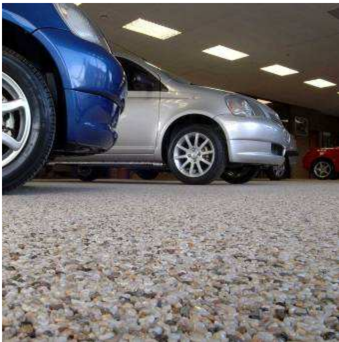
Gama standardowych kolorów